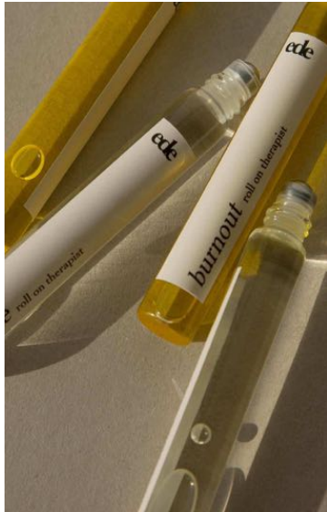
EDE_RO_BEST ede best day ever roll on therapist 10ml ハーバル、カンフル、スウィート Rosemary / Basil / Bergamot / Lavender

エッセンシャルオイルをブレンドした ロールオンアロマオイルは、気分やシーンによって使い分けることを提案しています。すべての製品はEveにより、ハンドメイドでUKで作られています。