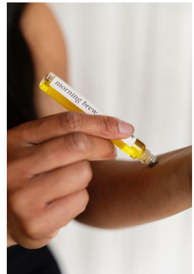
EDE_RO_MORN ede morning brew roll on therapist 10ml シトラス、フレッシュ、オリエンタル Orange / Grapefruit / Ginger / Lime