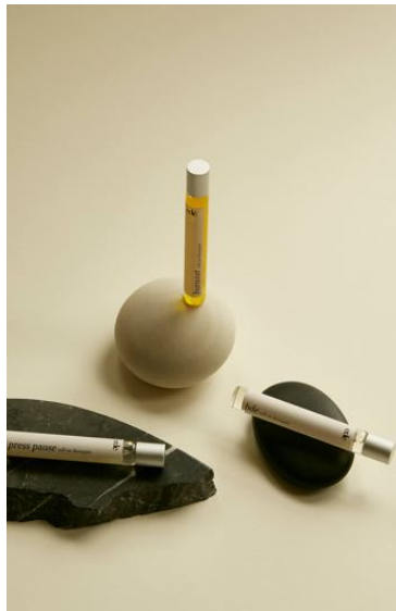
EDE_RO_BURN ede burnout roll on therapist 10ml スウィート、ハーバル、フローラル Clary Sage / Petitgrain / Geranium / Lavender