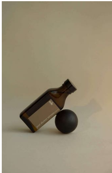
EDE_BO_100 ede post shower nirvana body oil 100ml