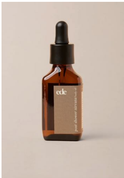
EDE_BO_30 ede post shower nirvana body oil 30ml